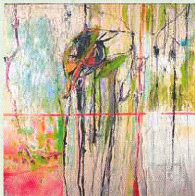
↑ Gerda Falke, "ORDERLY CHAOS", 2021

sind im Vorfeld des Besuches der Homepage der Pfarrei zu entnehmen.