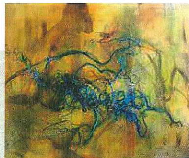
↑ Brigitte von der Eltz, "Lineare Poesie 1", 2020