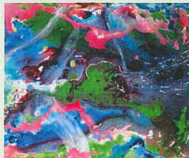
↑ Marianne Borchard, "Komposition Pastell"