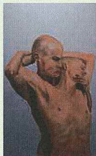
↑ Christiane Husmann, "Paar", 2014

Verschiedene Veranstaltungen (Orgelkonzert, Poetry Slam, Gesprächsabend) begleiten den Ausstellungszeitraum. Zu beachten ist, dass im gesamten Öffnungszeitraum wegen eines Gottesdienstes (Tauffeier, Schulgottesdienst, Requiem) die Ausstellung für jeweils eine Stunde nicht zugänglich sein kann. Nähere Informationen dazu und zu den Veranstaltungen im Begleitprogramm