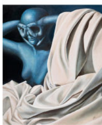
Bildmotiv: Grit Krüger, Blickwinkelveränderung

Am 09., 21. und 30. Mai sowie am 29./30.06.2024 geschlossen.